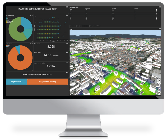
Anwendungsbeispiel M.App Enterprise

Kontaktieren Sie uns go.hexagongeospatial.com/contact-us-today